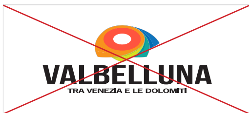
Non strecciare il marchio