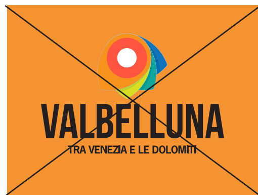
Non porre il marchio nella versione a colori su fondi che possano occultarne la leggibilità